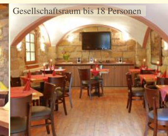
Gesellschaftsraum bis 18 Personen