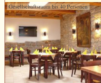
Gesellschaftsraum bis 40 Personen