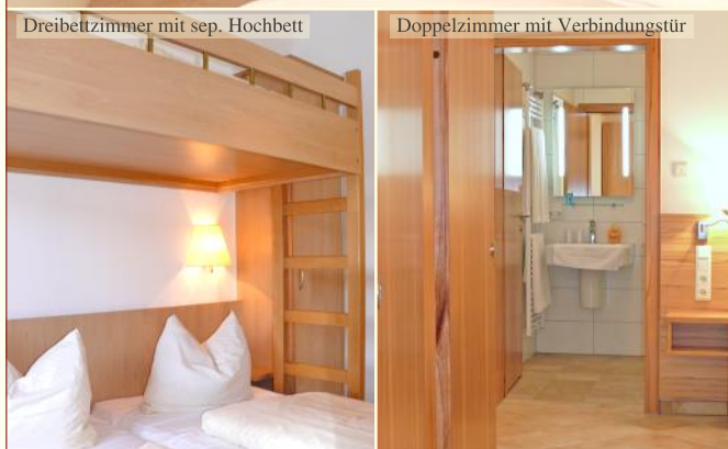
Dreibettzimmer mit sep. Hochbett